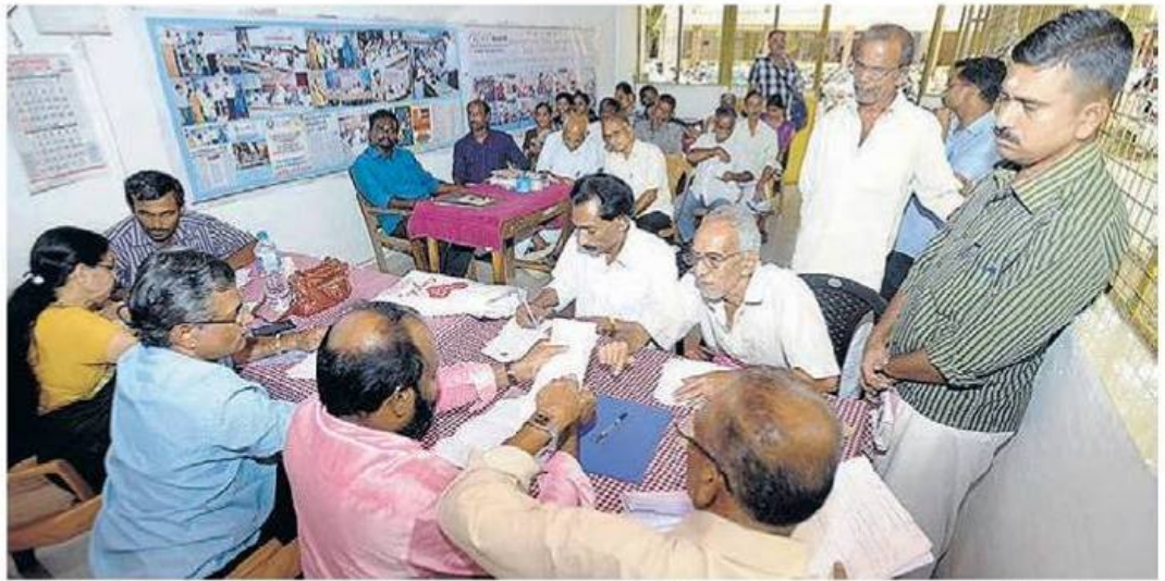
ജസ്റ്റീസ് വി.ആർ.കൃഷ്ണയ്യർ നിയമസഹായ കേന്ദ്രത്തിന്റെ നേതൃത്വത്തിൽ നടന്ന ജനകീയ നീതിമേളയിൽ നിന്ന്.