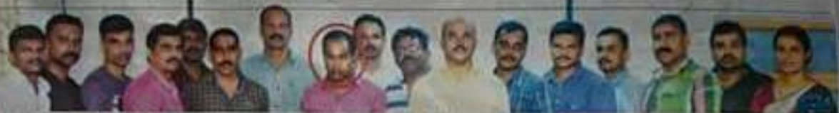
പാലക്കാട് ജില്ലാ പൊലീസ് ഓഫീസിലെ അദ്ധ്യക്ഷതയിൽ നടന്ന 'പാലക്കാട് സാമൂഹിക പ്രശ്നങ്ങൾ' എന്ന പേരിൽ നടന്ന കോർഡിനേറ്റർമാരുടെ യോഗം.