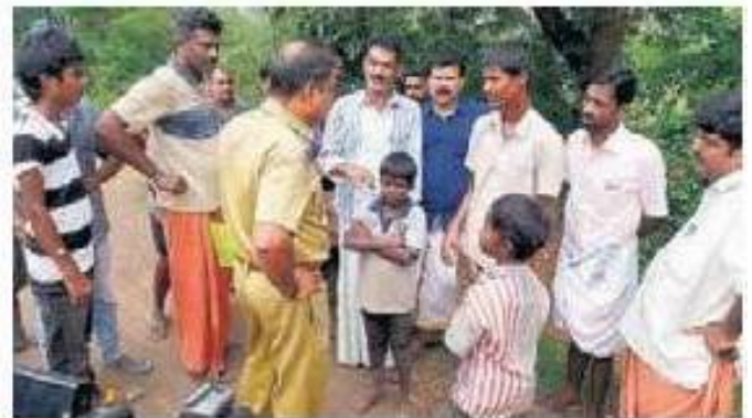
കുട്ടികളെ പൊലീസിനു കൈമാറുന്നു

ദിവസങ്ങളായി ഭക്ഷണം പോലും നൽകാതെ ക്രൂരമായ പീഡനമേറ്റിരുന്ന കുട്ടികൾ പ്രദേശവാസികളായ ബിജെപി പ്രവർത്തകരോടു ദുരിതജീവിതം അറിയിക്കുകയായിരുന്നു. വസ്ത്രവും ആവശ്യത്തിനു ഭക്ഷണവും നൽകാതെ ക്രൂരമായി പീഡനം അനുഭവിച്ചു കഴിഞ്ഞിരുന്ന കുട്ടികൾ രാത്രിസമയത്തും താരാവുകൾക്കൊപ്പമാണു കഴിഞ്ഞിരുന്നത്. കുട്ടികളുടെ ശരീരത്തിൽ അടിയേറ്റ പാടുകളും ഉണ്ടായിരുന്നു. ബിജെപി പ്രവർ