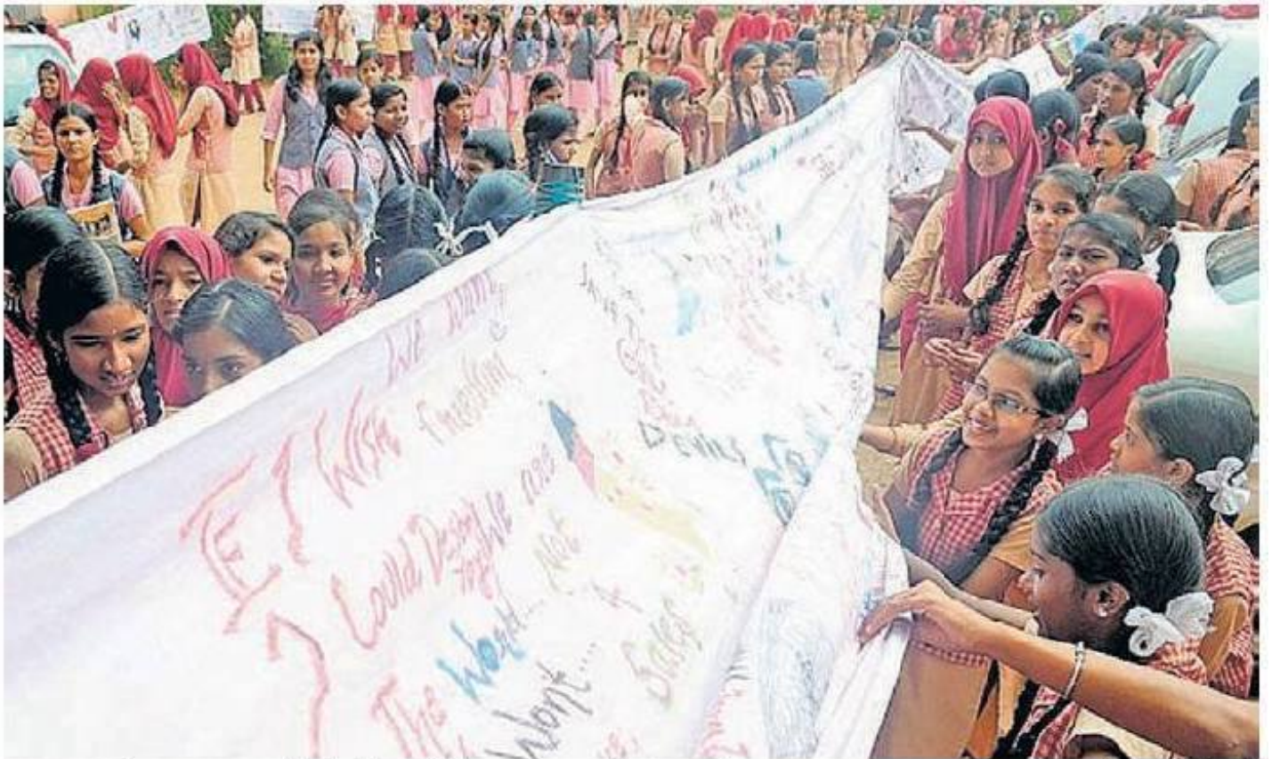
പാലക്കാട് ഗവ. മോയൻസ് സ്കൂളിൽ ഐക്യരാഷ്ട്രസഭ ദിനാചരണത്തോടനുബന്ധിച്ച് വിദ്യാർത്ഥികൾ തയ്യാറാക്കിയ കുറ്റൻ ബാനർ പ്രദർശിപ്പിക്കുന്നു.