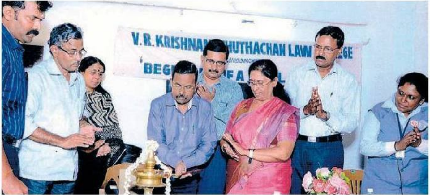
വിശ്വാസിന്റെ സന്നദ്ധസേന എലവഞ്ചേരി ലോ കോളജിൽ ജില്ലാ കലക്ടർ കെ. രാമചന്ദ്രൻ ഉദ്ഘാടനം ചെയ്യുന്നു