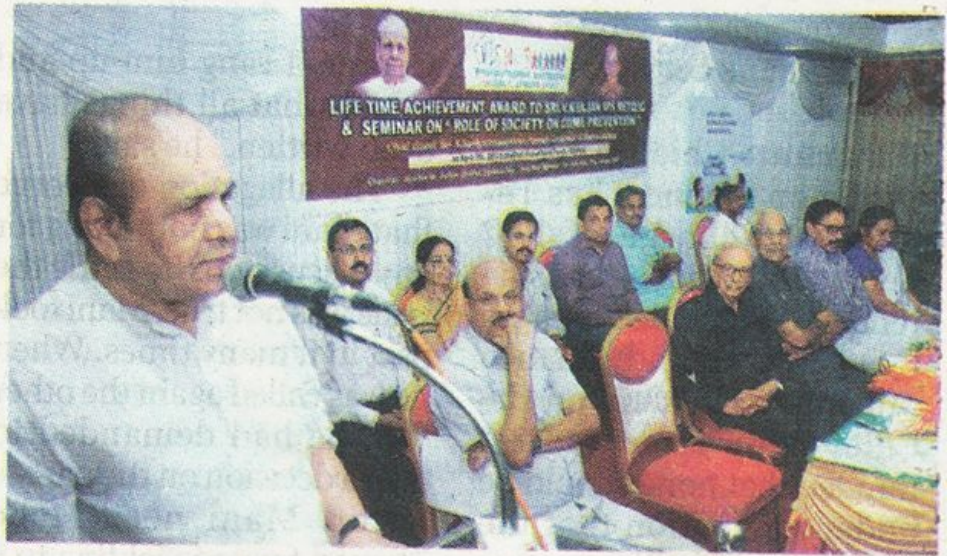
Former Governor K Sankaranarayanan speaking after inaugurating the seminar organised by Viswas at a function held in Palakkad on Tuesday