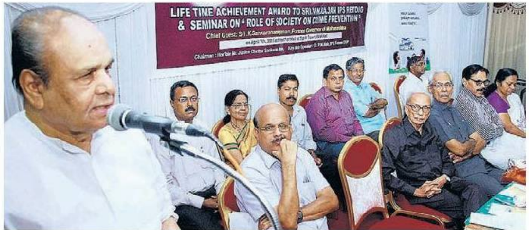
പാലക്കാട് വിശ്വാസ് ലൈഫ് ടൈം അച്ചീവ്മെന്റ് അവാർഡ് സമർപ്പണവും സെമിനാറും മഹാരാഷ്ട്ര മുൻ ഗവർണ്ണർ കെ. ശങ്കരനാരായണൻ ഉദ്ഘാടനം ചെയ്യുന്നു.

പാലക്കാട് • ജഡ്ജിമാരുടെ വിശ്വാസ്യത ഇല്ലാതാകുന്നത് ജനാധിപത്യത്തിന് അപകടമാണെന്ന് മഹാരാഷ്ട്ര മുൻ ഗവർണ്ണർ കെ. ശങ്കരനാരായണൻ. കാലത്തിനും സമൂഹത്തിന്റെ മാറ്റത്തിനുമനുസരിച്ച് നിയമങ്ങൾ മാറണം. അല്ലെങ്കിൽ മാറുന്ന കാലത്തിൽ അതിനു നിലനിൽപ്പില്ല. കുറ്റകൃത്യത്തിന്റെ എല്ലാവശങ്ങളും പരിഗണിച്ചു നിയമം നടപ്പാക്കേണ്ടവരായതിനാൽ ജഡ്ജിമാർ സ്വതന്ത്രരായിരിക്കണം. സമൂഹത്തിന്റെ വിശ്വാസവും അതാണ്. എന്നാൽ ആ സ്ഥിതിനഷ്ടപ്പെടുകയാണെന്ന് ജഡ്ജിമാർ തന്നെ പറയുന്നു. കുറ്റകൃത്യങ്ങൾക്ക് ഇരയായവരുടെ ക്ഷേമത്തിനായി പ്രവർത്തിക്കുന്ന വിശ്വാസ് കുറ്റകൃത്യങ്ങൾ തടയുന്നതിൽ സമൂഹത്തിന്റെ പങ്ക് എന്ന വിഷയത്തിൽ സംഘടിപ്പിച്ച സെമിനാർ